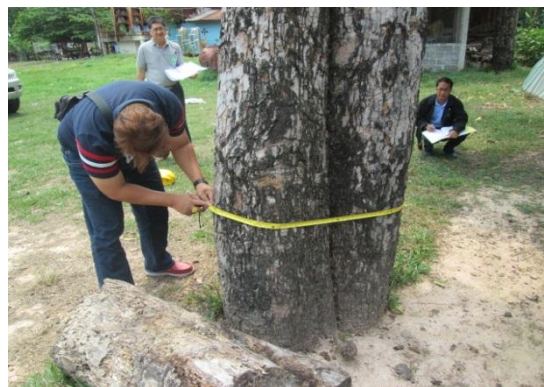
ภาพที่ ๗ ความโตของลำต้นเส้นรอบวง ๙๙.๕ นิ้ว ความสูง ๑๘ เมตร ทรงพุ่ม ๕ เมตร