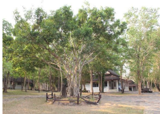
ภาพที่ ๑๑ สภาพภูมิทัศน์รอบบริเวณต้นไทรย้อย โดยทั่วไป สมบูรณ์ดี มีกาฝาก