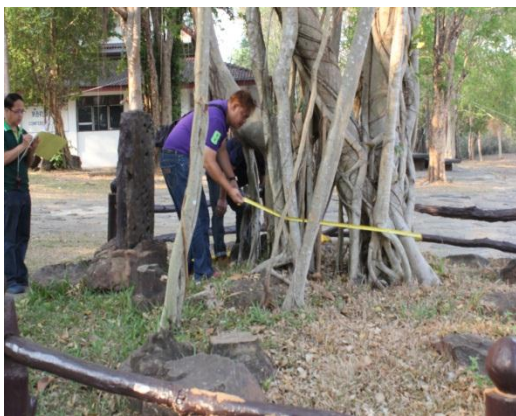
ภาพที่ ๑๒ ความโตของลำต้นเส้นรอบวง ๑๓๔ นิ้ว