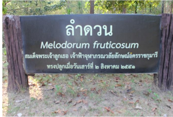
ภาพที่ ๒๒ ป้ายชื่อสมเด็จพระเจ้าลูกเธอ เจ้าฟ้าจุฬาภรณวลัยลักษณ์อัครราชกุมารี ทรงปลูก

สมเด็จพระเจ้าลูกเธอ เจ้าฟ้าจุฬาภรณวลัยลักษณ์อัครราชกุมารี ทรงปลูกต้นลำดวน เมื่อวันที่ ๒ สิงหาคม ๒๕๕๑ ณ สถานีเพาะเลี้ยงสัตว์ป่าจุฬาภรณ์ อำเภอเขาค้อ จังหวัดศรีสะเกษ