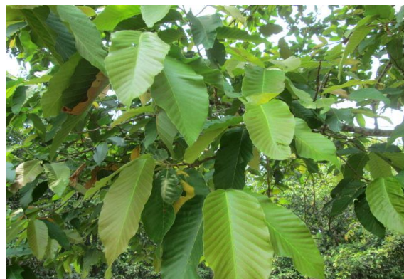
ภาพที่ ๔ ใบต้นยางนา โรค / แมลง ไม่มี