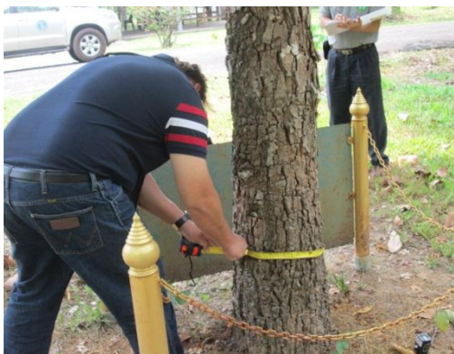
ภาพที่ ๓ ความโตของลำต้นเส้นรอบวง ๔๓ นิ้ว