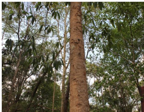
ภาพที่ ๒๑ ลำต้นมีมอดเจาะ