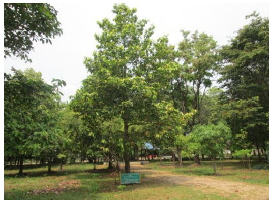
ภาพที่ ๒ สภาพภูมิทัศน์รอบบริเวณต้นยางนา โดยทั่วไป สมบูรณ์ดี ความสูงของต้นยางนา ๑๒.๕ เมตร ทรงพุ่ม ๑๐.๑๐ เมตร