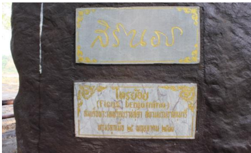
ภาพที่ ๑๐ ป้ายชื่อสมเด็จพระเทพรัตนราชสุดาฯ สยามบรมราชกุมารี ทรงปลูก