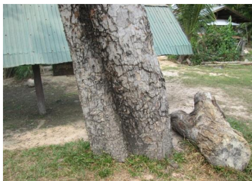
ภาพที่ ๘ โคนต้น เปลือกแตก