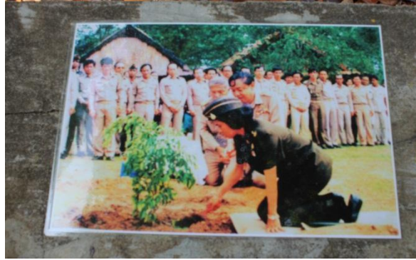
ภาพที่ ๙ ภาพถ่ายขณะทรงปลูก

สมเด็จพระเทพรัตนราชสุดาฯ สยามบรมราชกุมารี ทรงปลูกต้นไทรย้อย เมื่อวันที่ ๒๕ พฤษภาคม ๒๕๓๓ ณ ศูนย์บริการนักท่องเที่ยวอุทยานแห่งชาติแก่งตะนะ อำเภอโขงเจียม จังหวัดอุบลราชธานี