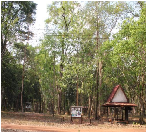
ภาพที่ ๑๙ สภาพภูมิทัศน์รอบบริเวณต้นยางนา โดยทั่วไป สมบูรณ์ดี