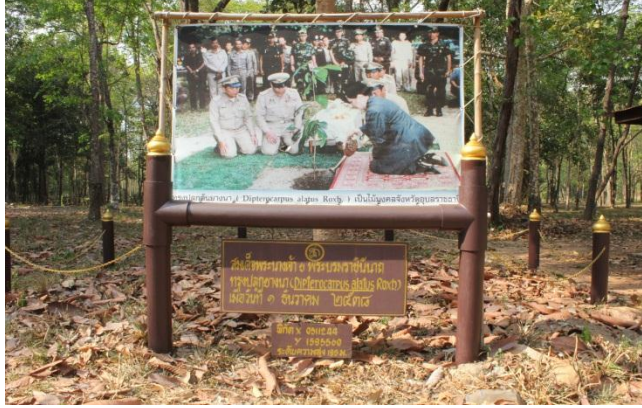
ภาพที่ ๑๘ ภาพถ่ายขณะทรงปลูก

สมเด็จพระนางเจ้าสิริกิติ์ พระบรมราชินีนาถ ทรงปลูกต้นยางนา เมื่อวันที่ ๑ ธันวาคม ๒๕๓๘ ณ เขตรักษาพันธุ์สัตว์ป่ายอดโดม อ.น้ำยืน จ.อุบลราชธานี