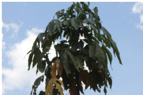
ภาพที่ ๑๗ ใบต้นจอง (สำรอง) โรค/แมลง ไม่มี