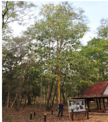
ภาพที่ ๒๐ ความโตเส้นรอบวง ๒๗.๕ นิ้ว ความสูง ๑๓ เมตร ทรงพุ่ม ๘.๒ เมตร