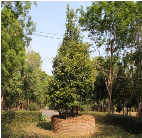
ภาพที่ ๒๓ สภาพภูมิทัศน์รอบบริเวณต้นลำดวน โดยทั่วไป สมบูรณ์ดี โรค/แมลง ไม่มี