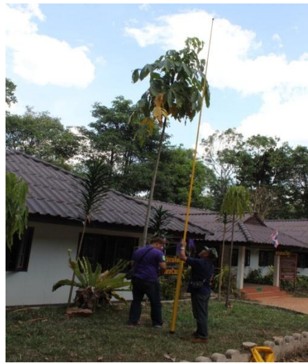
ภาพที่ ๑๖ ความสูง ๖.๗ เมตร ทรงพุ่ม ๑.๗ เมตร