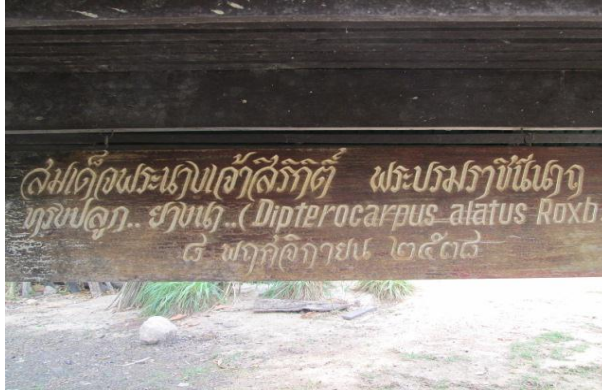
ภาพที่ ๕ ป้ายชื่อสมเด็จพระนางเจ้าสิริกิติ์ พระบรมราชินีนาถ ทรงปลูก

สมเด็จพระนางเจ้าสิริกิติ์ พระบรมราชินีนาถ ทรงปลูกตันยางนา เมื่อวันที่ ๘ พฤศจิกายน ๒๕๓๘ บริเวณ ศาลาประชาคม บ้านน้อมเกล้า ต.บุงคำ อ.เลิงนกทา จ.ยโสธร