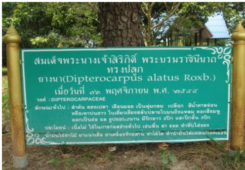
ภาพที่ ๑ ป้ายชื่อสมเด็จพระนางเจ้าฯ พระบรมราชินีนาถ ทรงปลูก

เมื่อวันที่ ๑๖ พฤศจิกายน ๒๕๔๔ บริเวณ กอ.รมน.โครงการส่งเสริมศิลปาชีพบ้านเล็กในป่าใหญ่ บ้านน้อมเกล้า ต.บุงคำ อ.เลิงนกทา จ.ยโสธร