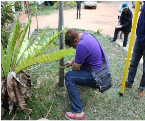
ภาพที่ ๑๕ ความโตของลำต้นเส้นรอบวง ๑๐ นิ้ว