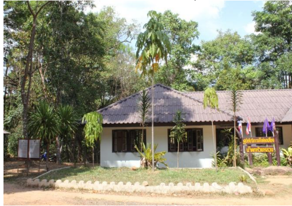
ภาพที่ ๑๔ สภาพภูมิทัศน์รอบต้นจอง โดยทั่วไปสมบูรณ์ดี

พระเจ้าวรวงศ์เธอ พระองค์เจ้าโสมสวลี พระวรราชธิดาตามาตุ ทรงปลูกต้นจอง เมื่อวันที่ ๑๗ พฤศจิกายน ๒๕๕๒ ณ อุทยานแห่งชาติภูจองนายอย อำเภอนาจะหลวย จังหวัดอุบลราชธานี