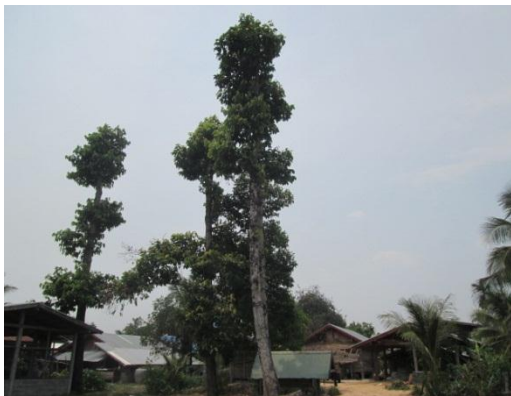
ภาพที่ ๖ สภาพภูมิทัศน์รอบตันยางนา โดยทั่วไป สมบูรณ์ดี โรค/แมลงไม่มี