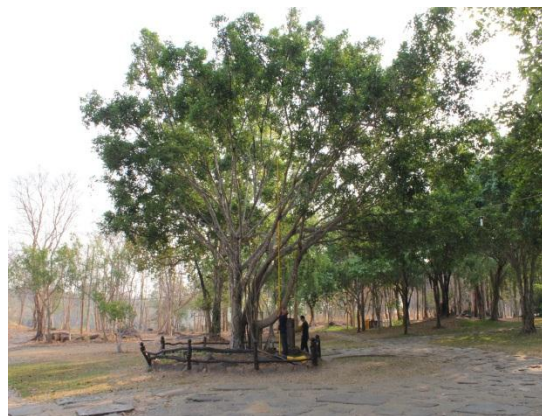
ภาพที่ ๑๓ ความสูง ๑๐.๘ เมตร ทรงพุ่ม ๑๖ เมตร