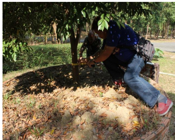
ภาพที่ ๒๔ ความโตเส้นรอบวง ๑๑.๕ นิ้ว ความสูง ๔.๗ เมตร